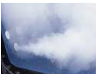
30 seconds after