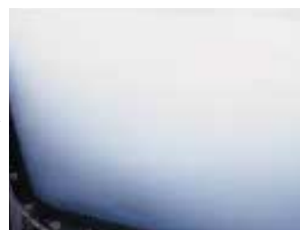
1 minute after